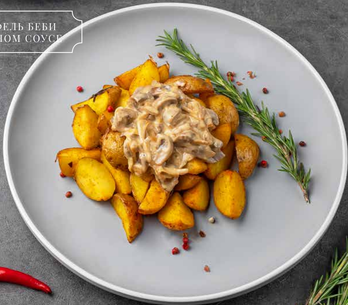
КАРТОФЕЛЬ БЕБИ В ГРИБНОМ СОУСЕ