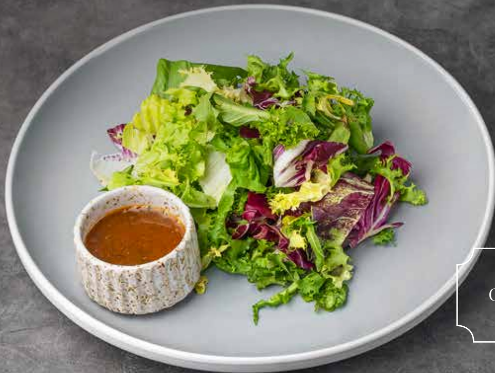
МИКС САЛАТОВ С КИСЛО-СЛАДКОЙ ЗАПРАВКОЙ